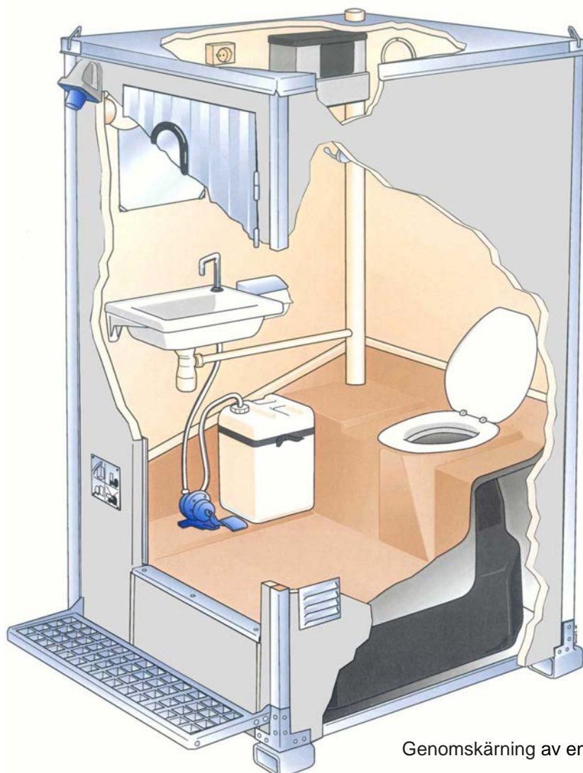
Genomskärning av en Toalettkabin med latrintank.

Alla enheter är lätta att flytta och transportera. Kabinerna kan användas permanent eller periodvis på till exempel golfbanor, campingplatser och arbetsplatser inom bygg- och tillverkningsindustrin.